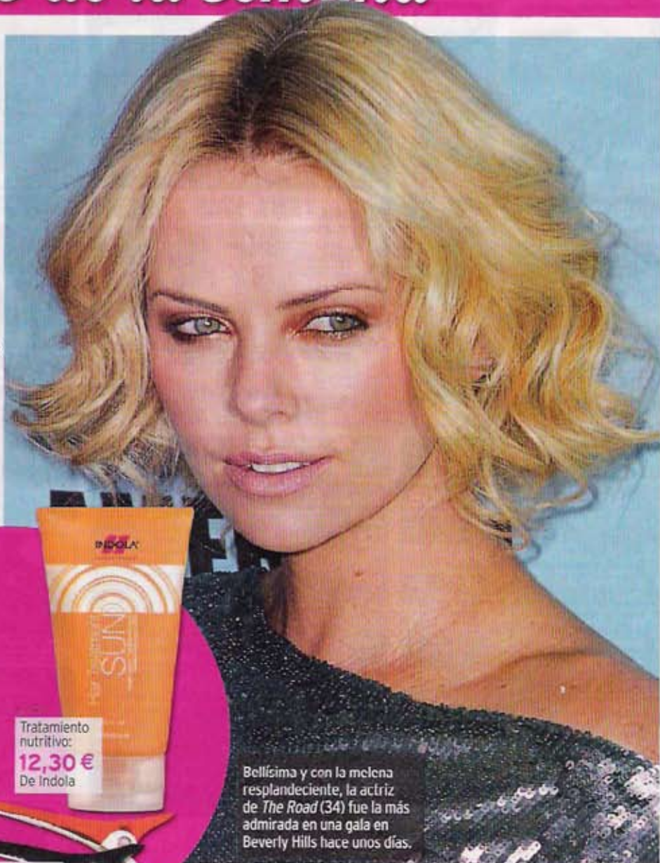
Bellísima y con la melena resplandeciente, la actriz de The Road (34) fue la más admirada en una gala en Beverly Hills hace unos días.

índice y corazón. Fija con una pinza y seca al aire libre o con secador. Tras esto quita la pinza y con los dedos aplica un spray que aporte brillo. Peina con las manos para deshacer el rizo.