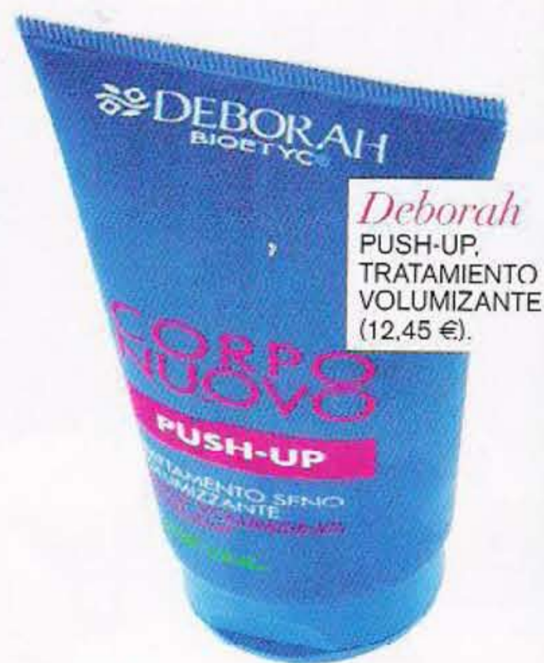
Deborah PUSH-UP, TRATAMIENTO VOLUMIZANTE (12,45 €).