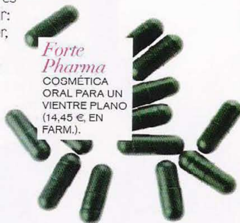
Forte Pharma COSMÉTICA ORAL PARA UN VIENTRE PLANO (14,45 €, EN FARM.).