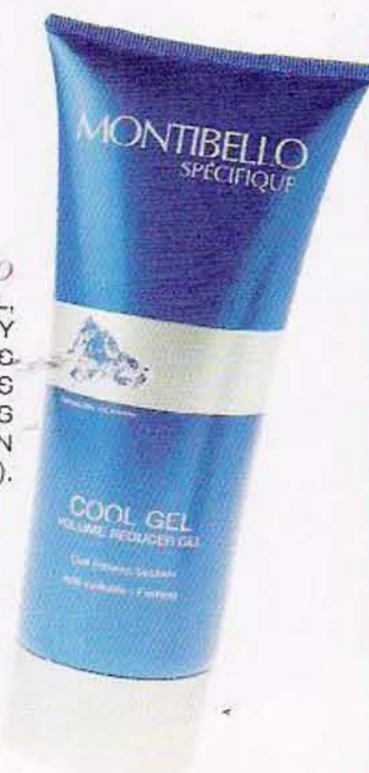
Montibello COOL GEL, RELAJA Y REFRESCA LAS PIERNAS CANSADAS (33,45 €, EN INST.).