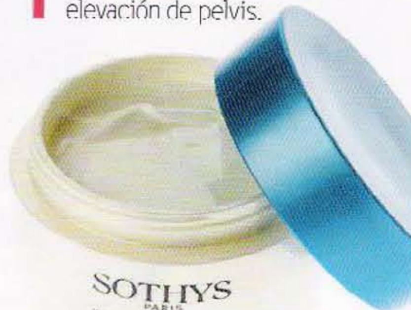
SOETHYS PARIS Sothys CREMA REAFIRMANTE HALASSOTHYS (58 €, EN INST.).