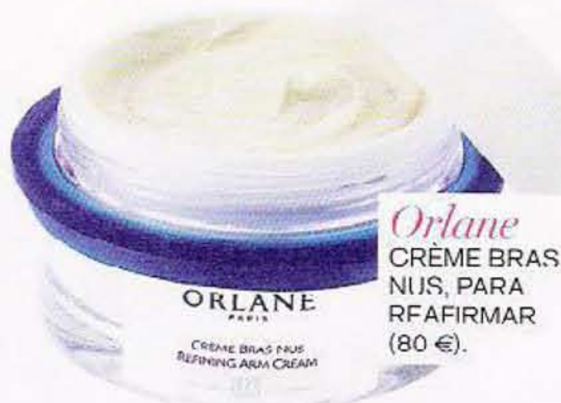
Orlane CRÈME BRAS NUIS, PARA REAFIRMAR (80 €).